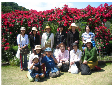
ご参加頂いた皆様と記念撮影

この一日だけで、今の季節でしか見ることのできない植物にたくさん触れることができ、大満足です！ガーデンは、ほとんど一年中、その季節ごとに花が楽しめるように構成されているそうです。緑の多さや花の色鮮やかさが、あわただしい日常を忘れさせ、気持ちにゆとりが戻ってくるようでした。皆様も、たまには自然と触れ合いながら、そんな充実した時間を過ごしてみたいはいかがでしょうか？普段気付くことのない、いろんな発見ができるかと思えます！