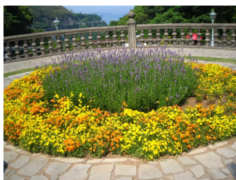
鮮やかな花に囲まれたラベンダー

ハーブ&ローズガーデン内では、頂上まで園内の専用バスに乗せてもらい、たくさんの花々を見ながら麓まで散策します。左右どこを見ても、綺麗で鮮やかな花が目にとまります。こんなに色とりどりの花を見る機会は滅多にないので、皆さんじっくりとご覧になっていたようです。ローズガーデンでは、一歩足を踏み入れただけで、ふわ~っと甘いバラの香りに包み込まれて、とても優雅でした