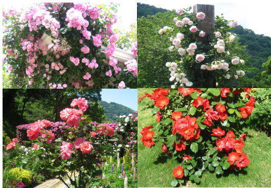
たくさんの種類や色、大きさのローズがありました！

ハーブ&ローズガーデン内では、頂上まで園内の専用バスに乗せてもらい、たくさんの花々を見ながら麓まで散策します。左右どこを見ても、綺麗で鮮やかな花が目にとまります。こんなに色とりどりの花を見る機会は滅多にないので、皆さんじっくりとご覧になっていたようです。ローズガーデンでは、一歩足を踏み入れただけで、ふわ~っと甘いバラの香りに包み込まれて、とても優雅でした