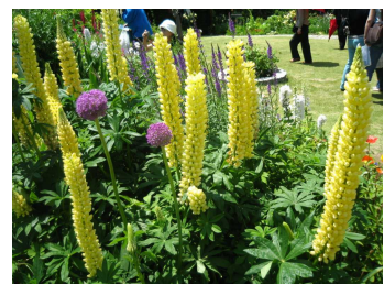
この黄色い花の名前、ご存知ですか？ 『ルピナス』だそうです！

ハーブガーデンでは至るところにローズマリーがあり、指で触っては香りを嗅いで...という光景を目にしました。目で見るだけでなく、手に触れて香りまで楽しめるというのがハーブの魅力ですね