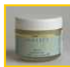
ジェントルピールウォッシュ 50ml ¥6,825(税込)

スクラブなどのディープ洗顔と違い、お顔全体に塗布して、こすらず押さえ込むのがポイント。肌に必要な栄養をきちんと与えながら、古い角質が溶けるようにして落ちていくので、とても安心して使えます。