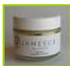
ジェントルクリアリングウォッシュ 50ml ¥5,775(税込)

ジャネスのディープ洗顔は、肌に負担をかけることなく、やさしく角質を取り除き、穏やかに働きかけます。週2～3回、洗顔後に使用するだけで、パックの役割も兼ねており、しっかりと透明感のある美しいお肌に仕上がります。